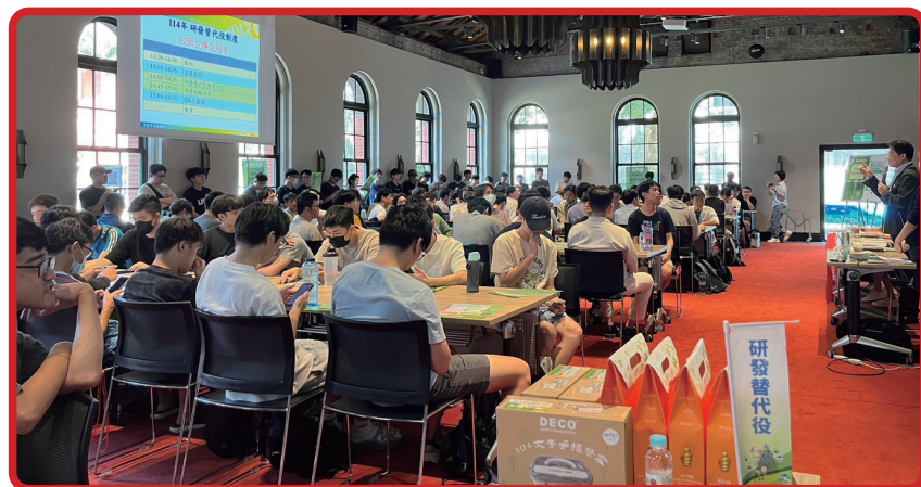
役政司沈哲芳司長兼執行長（圖右站立者）向同學介紹研發替代役制度

活動在熱烈掌聲中圓滿結束，不少同學表示透過此次宣導，更加清楚研發替代役制度與生涯規劃的連結，也對自身未來服役及就業方向有更完整的思考。