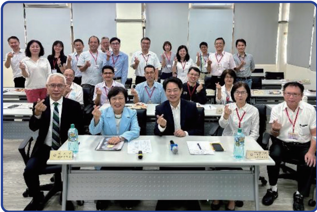
劉世芳部長(前排左二)與役政司沈哲芳司長兼執行長(前排左三)鼓勵役政人員，推動替代役支援災害防救工作

盱衡當前配合政府強化全民國防兵力結構調整方案，替代役參與災防救護、治安巡守、社福照護、民防整備等任務，持續支援社會持續穩定運作，已成為我國國家災防體系中不可或缺的力量，爰致力推動各役政管理人員，不僅須熟稔我國強化全社會防衛韌性與替代役人力運用政策，更應具備對重大治安及災害風險的敏銳意識與應變知能，以確保役男服役安全的前提下，妥善規劃現役勤務與備役召訓，發揮替代役支援災防、穩定社會的功能。