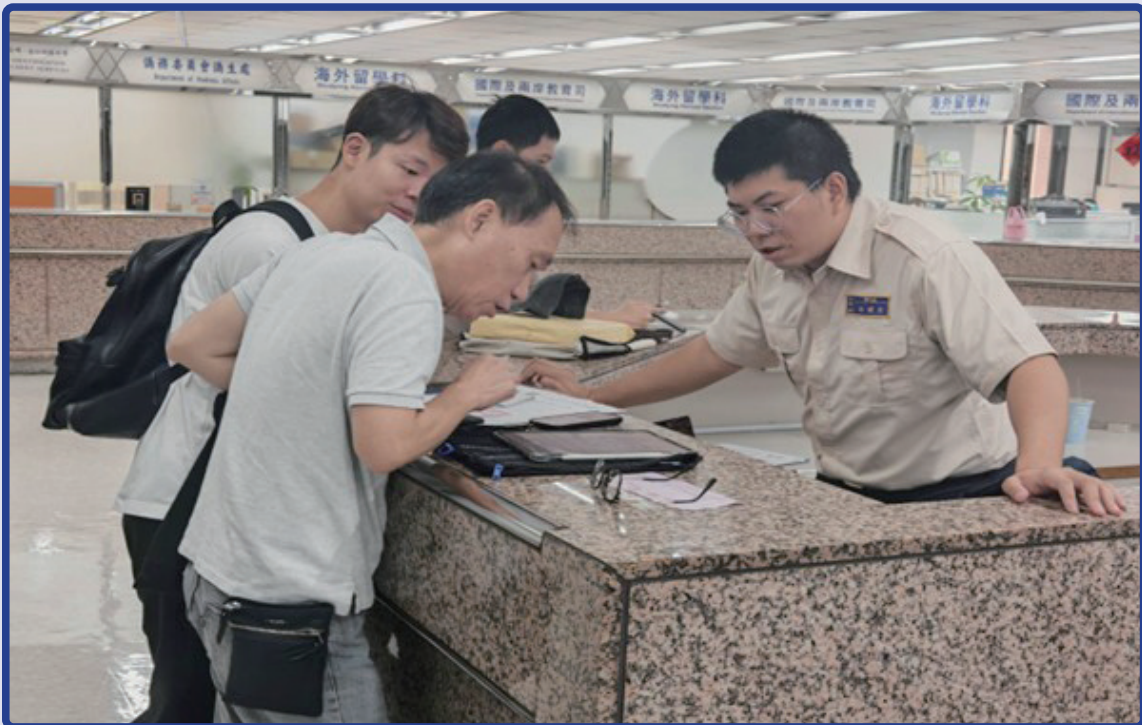
役男於僑務委員會協助僑民役男上傳文件審查事項

連結，以及僑民役男身分認定的標準合理化。因此修正僑民役男入境後再出境之辦理程序，需檢附「役政用華僑身分證明書」、「往返僑居地之證明文件」等文件以申請出境。圖一為役男於僑務委員會協助僑民役男上傳文件審查事項。圖二為役男於僑務委員會協助向僑民役男說明相關辦理事項。