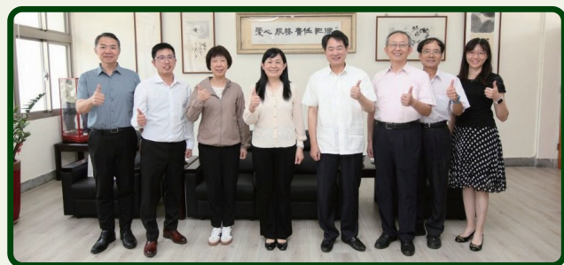
政戰局陳育琳局長（左4）與役政司沈哲芳司長兼執行長（右4）暨相關幹部合影留念