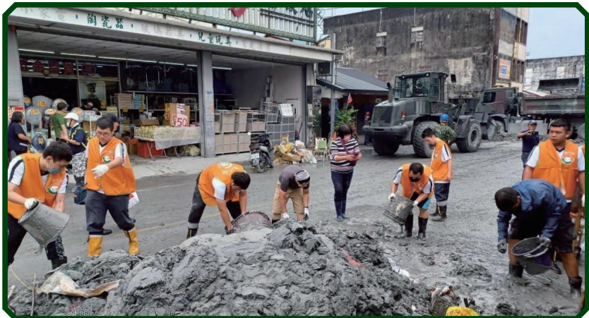
災後復原工作現場

另役政司沈哲芳司長兼執行長趕赴現場，向第一線的替代役役男及役政同仁致以深切慰問，特別強調役男們持有三證照(EMT-1、志願服務、防災士)，是災區現場有價值的人力。並盛讚役男們能在艱困環境中辛勞付出，是當之無愧的「最帥的男人」，並感謝役政同仁的迅速調度與群策群力。