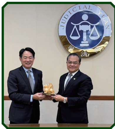
役政司沈哲芳司長兼執行長（左1）拜會司法院刑事廳李欽任廳長（右1），致贈紀念獎座並合影

7月1日拜會法務部鄭銘謙部長，諮詢妨害兵役案件偵查及執行經驗。雙方達成共識，認為妨害兵役已是國安問題。法務部將採取具體行動，包括近期召開之檢察長會議中，安排新北地檢署分享偵辦「閃兵集團」案例，宣導嚴厲偵辦的重要性，並鼓勵檢察官對輕判案件具體求刑後提上訴，以達警惕、維護兵役公平。