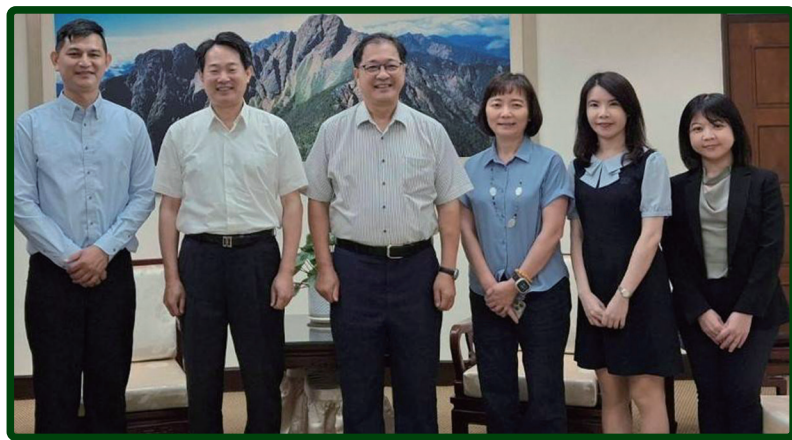
役政司沈哲芳司長兼執行長（左2）率相關同仁拜會法務部鄭銘謙部長（右4）、檢察司張曉雯司長（右3）、簡美慧副司長（右2）及王玉如主任檢察官（右1）

7月22日再次率役政司同仁拜會司法院刑事廳李欽任廳長，請益案件審理實務。雙方深入探討案件趨勢與特性，讓司法院理解妨害兵役對國家法益的嚴重侵害。司法院將透過法官學院開設「妨害兵役案件量刑探討」課程，強化法官處理共識。役政司亦彙整各類妨害兵役態樣及案例供司法機關參考，期盼透過機關協力，共同強化防制措施。