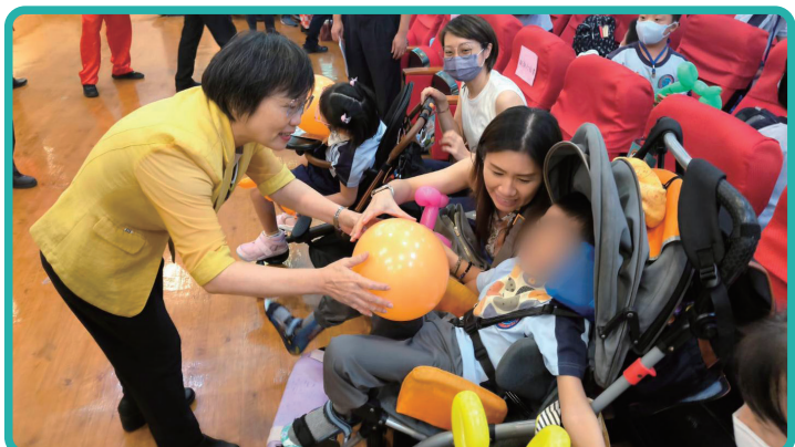
內政部劉世芳部長(左)與台中啟聰學校學童互動關懷