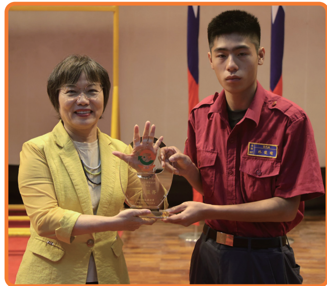
劉世芳部長頒發獎牌予第30萬本志願服務紀錄冊受獎役男