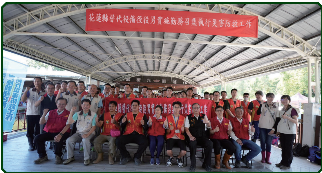
內政部劉世芳部長(前排中)及同仁與替代役備役役男合影