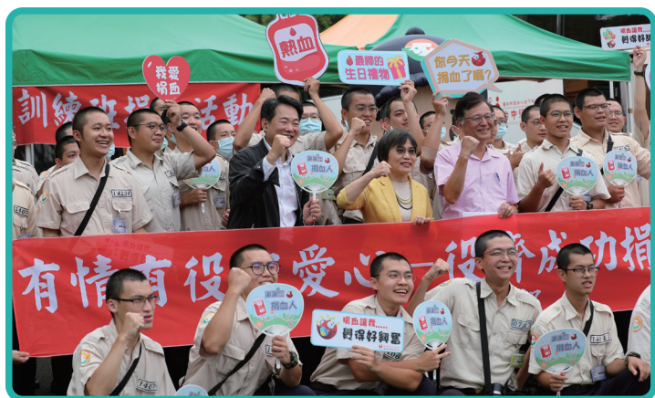
內政部劉世芳部長及役政司沈哲芳司長兼執行長與參與捐血活動役男合影